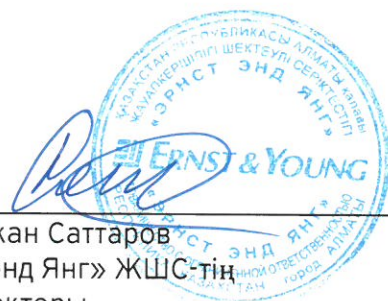
Рустамжан Саттаров «Эрнст энд Янг» ЖШС-тің Бас директоры

Қазақстан Республикасы Қаржы министрлігі 2005 жылғы 15 шілдеде берген сериясы МФЮ- 2 № 0000003 болатын Қазақстан Республикасының аумағында аудиторлық қызметпен айналысуға арналған мемлекеттік лицензия