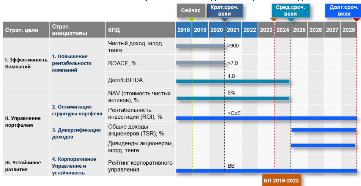
Четыре ключевые инициативы по развитию, связанные со стратегическим видением и целями Фонда

В краткосрочной перспективе , Фонд сосредоточится на повышении эффективности операционной, финансовой и инвестиционной деятельности портфельных компаний. Таким образом, приоритетными областями в краткосрочной перспективе для Фонда будут финансовая устойчивость крупных компаний , пересмотр перечня инвестиционных проектов по всей группе компаний Фонда, с особым вниманием к растущим компаниям, привлечение стратегических партнеров , улучшение операционной эффективности компаний до уровня лучших компаний отраслей, выход из участия в не стратегических активах , пересмотр подходов Программы трансформации .